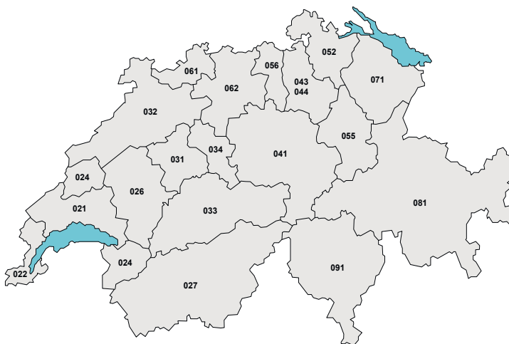
Figura 1: Indicativi per i servizi di rete fissa del piano di numerazione E.164